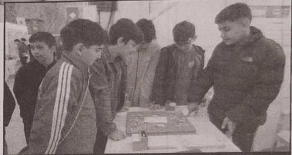
29 farklı üniversiteden, 118 öğretim üyesinin görev olarak sergilenmeye uygun gördüğü projeleri belirlediği sergi, yarına kadar ziyaret edilebilecek

Amaçlarının gençleri bilime yönlendirmek olduğuna dikkat çeken OMÜ Rektör Yardımcısı Prof. Dr. Çetin Kurnaz, "Başvuruların 11 bin 145'i devlet, 2 bin 773'ü ise özel okullardan yapıldı. Projelerde görev alan öğrenci sayısı 20 bin 726'dır. 11 bin 406 kız ve 9 bin 320 erkek